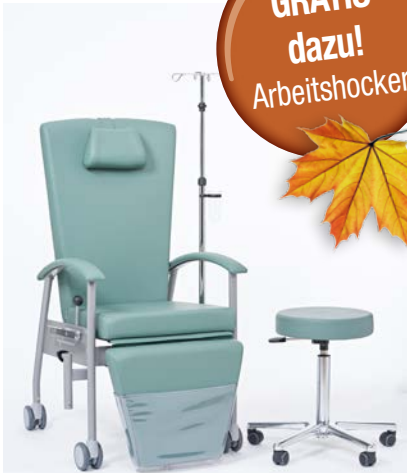
Abb. zeigt optionale Zubehörteile