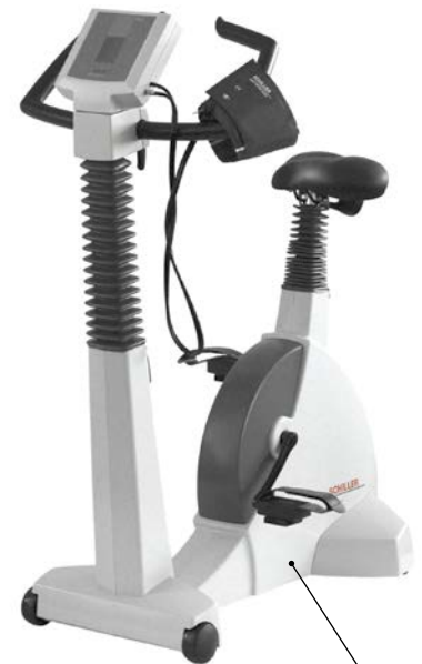
Sana Bike 1000 flüsterleises Ergometer