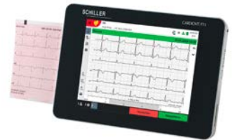
Cardiovit FT-1 Einzigartig: PC-EKG-Rekorder der vollkommen autark einsetzbar ist